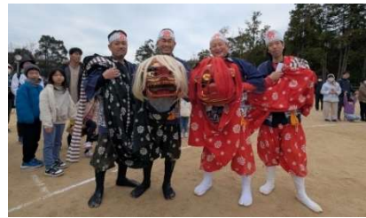
いつもありがとうございます