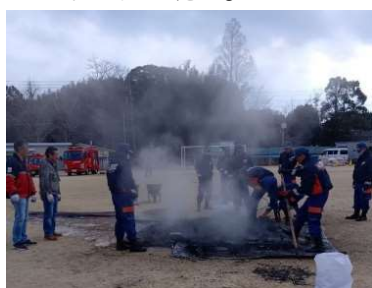
消防団のみなさんの見守る中 しっかり消火