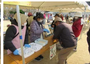
ぜんざいのお接待