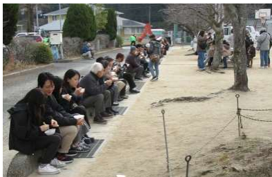
おいしかったかな