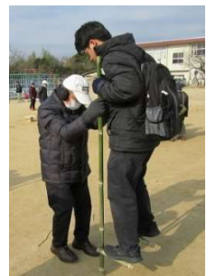
上手にできるかな